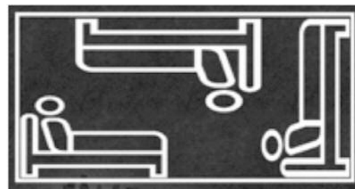
Illustrationen viser forskellen på et ordinært børne-/ungdomsværelse og et værelse i en overbefolket bolig. De unges egen illustration (Urban Dreams 2018).

unge står på gaden, end den traditionelle fortællings.