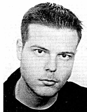
Mijailo Mijailovic, der mydede Anna Lindh.