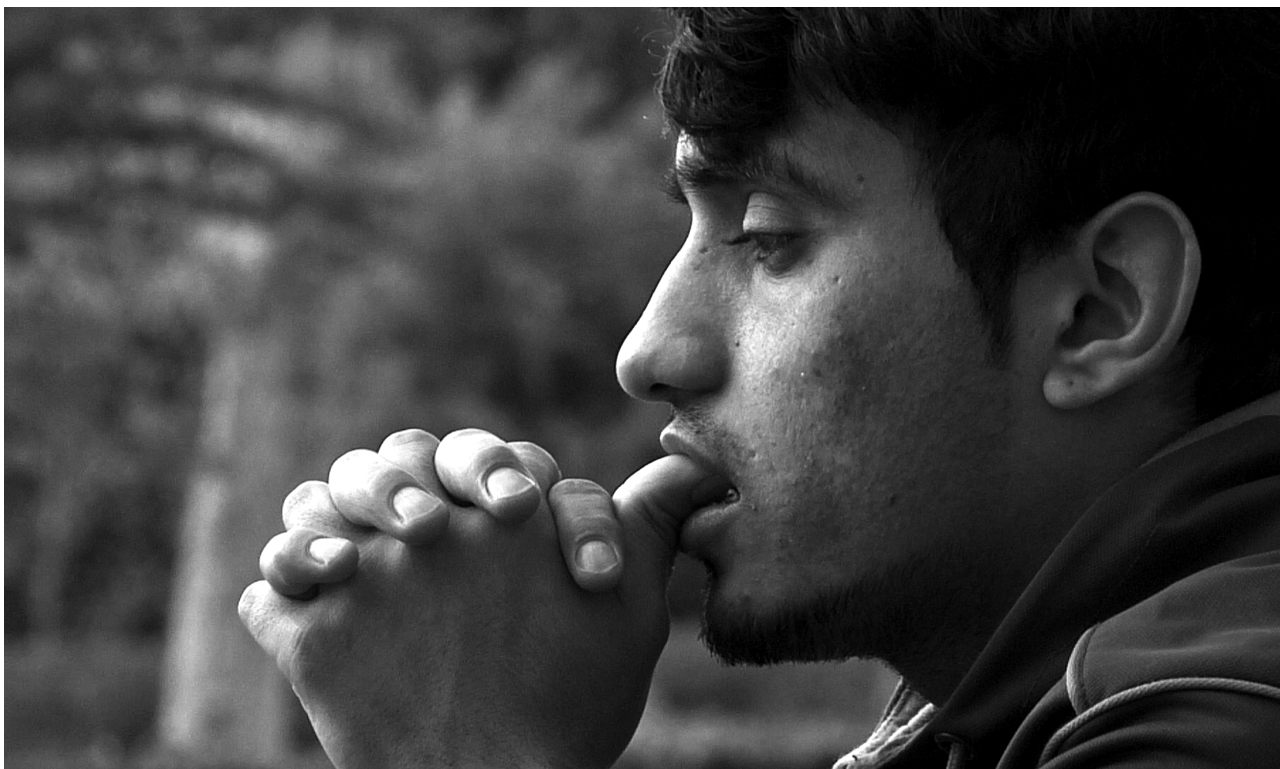
Kombinationen af at midlertidige ophold nu blot gives for to år af gangen samt det faktum, at Danmark er begyndt at hjemsende afviste asylansøgere til Afghanistan skaber en masse stress og udvidet usikkerhed.

bejdsmarkedet og leve af velfærdsydelse, så er vores afghanske interviewdeltagere frustrerede over, at de ikke må eller kan få fæste på det rigtige arbejdsmarked. Faktisk, så vidt vi har set, er det undertiden sagsbehandleren, der hindrer deres muligheder for at få et job, fordi de vil have flygtningene til at blive i integrationsprogrammet 22) . Endelig er en væsentlig forskel, at langtidsledige danskere 'kun' risikerer økonomiske sanktioner, mens afghanerne (med rette eller ej) frygter at blive sendt ud af landet, hvis de ikke følger integrationsprogrammet og passer deres praktik.