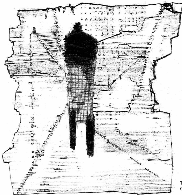
Tegning: Gert Hansen

hedslovgivningen: Lovgivning, som giver ret til lige muligheder eller sagt med andre ord: lovgivning som gør det forbudt at forskelsbehandle på grundlag af tilhørsforhold til den udsatte gruppe. Siden 1970'erne i USA har dette krav om rettighedslovgivning spredt sig til næsten samtlige lande i verden og det har fundet genklang i menneskeretten.