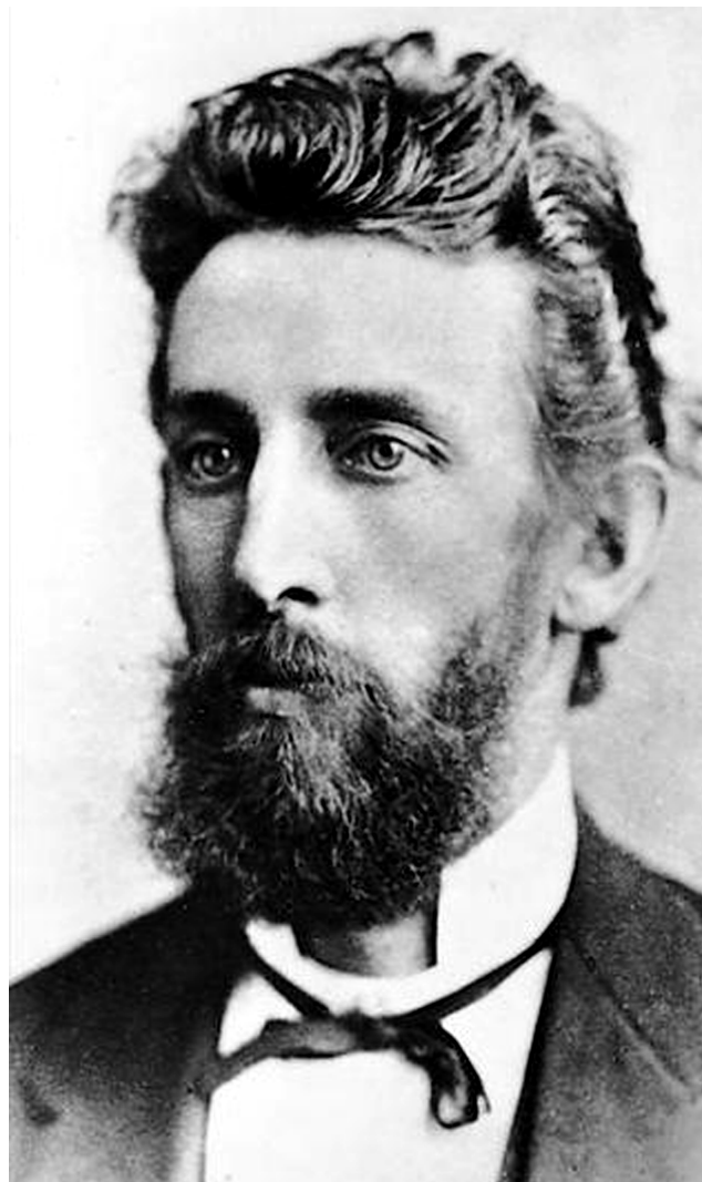
LOUIS PIO – spørgsmålet, om Socialdemokratiets grundlægger var revolutionær eller ej, var ikke særlig interessant.

Den socialdemokratiske arbejderbevægelse i Danmark er en af de få arbejderbevægelser i verden, der har en ubrudt historie fra Karl Marx' og Friedrich Engels' egen tid. Det har været meget diskuteret, om Louis Pio – Socialdemokratiets grundlægger – var 'revolutionær' eller ej, men spørgsmålet er ikke særlig interessant, dels fordi det ikke sås som noget problem i tidens arbejderbevægelse – altså i 1870'erne – dels fordi det alt afgørende for dansk arbejderbevægelse blev, at der blev dannet fagforeninger til varetagelse af kampen for løn og arbejdsforhold, og at disse fagforeninger fra begyndelsen forbandt sig med den politiske kamp. Allerede i 1886 afholdt de tre skandinaviske arbejderpartier en arbejderkongres i Göteborg, hvor det blev slået fast, at fagforeningerne skulle "søge at øve indflydelse på lovgivningsarbejdet ved at virke hen til, dels at arbejderne bliver politisk ligestillede med samfundets øvrige klasser, dels at folkerepræsentationen behandler arbejdernes økonomiske stilling og vedtager love, der sikrer arbejderne mod hensynsløs udbytning fra kapitalisternes side". Derfor skulle fagforeningerne både beskæftige sig med faglige og med politiske spørgs-