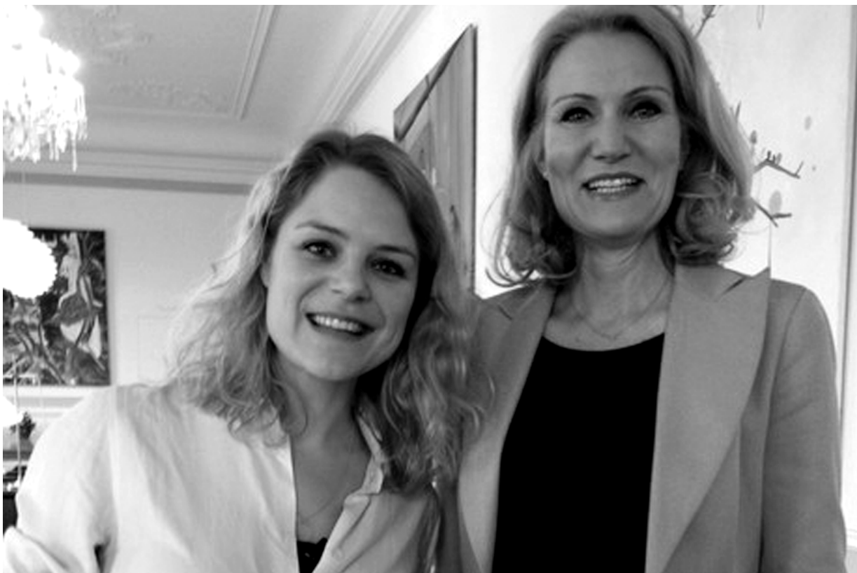
JOHANNE SCHMIDT-NIELSEN OG HELLE THORNING-SCHMIDT.

“Venstrefløjens idé – og her tænker jeg på det, der i hvert fald samler eller samlede Socialdemokraterne, SF og Enhedslisten – om det chancelige samfund må siges at være et rimeligt alternativ til idéen om offentlig overtagelse af produktionsmidlerne, som har vist sig urealiserbar overalt, i hvert fald på dette tidspunkt i historien.”