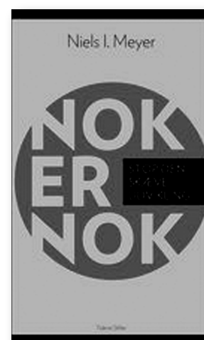
Niels I. Meyer: Nok er nok. Tiderne Skifter 2013, 88 sider, kr. 125,-.

Verdenshistoriens heldigste pensionister kunne meget vel være den privilegerede del af de ældre danskere, der nu forgylder støvets år med oplevelser, relationer og materielle goder i et hidtil uset omfang. En del af os har oven i købet haft gode muligheder for at ytre os og søge indflydelse, og mange har været båret af en tro på, at det nytter at blande sig. En tro der dog på det seneste er blevet mødt af en omkringsigribende relativisme og usikkerhed i forhold til fremtiden.