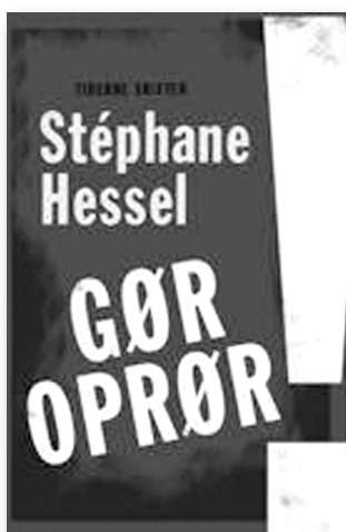
Stéphane Hessel: Gør oprør. Tiderne Skifter 2011, 38 sider, kr. 48,-.