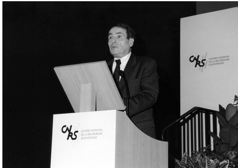
Bourdieu holder sin takketale.

tiv selvtilegnelse – og således konkret realisere det kald, som filosofien traditionelt har varetaget. 17)