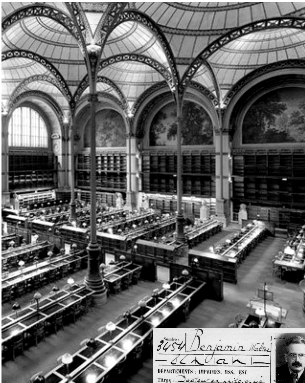
Bibliothèque Nationale. 'Det maledede løv i loftet af Bibliothèque Nationale. Når der blades nede, bruser det ovenover', Walter Benjamin, Arcade Projektet.

Walter Benjamins Bibliotekskort til Bibliothèque Nationale, Paris 1940.