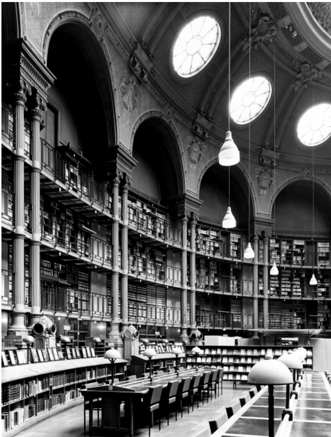
En let afskærmet plads – som Foucaults – i halvcirklen på Bibliothèque Nationale, Paris.