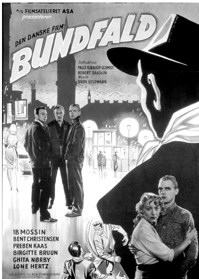
Plakat fra filmen "Bundfald" fra 1957 om unge fra provinsen der strømmer til København i håb om nye muligheder. Nogle ender som subsistensløse eller 'trækkerdreng'.

skulle straffes, det var jo en sygdom i deres psyke.