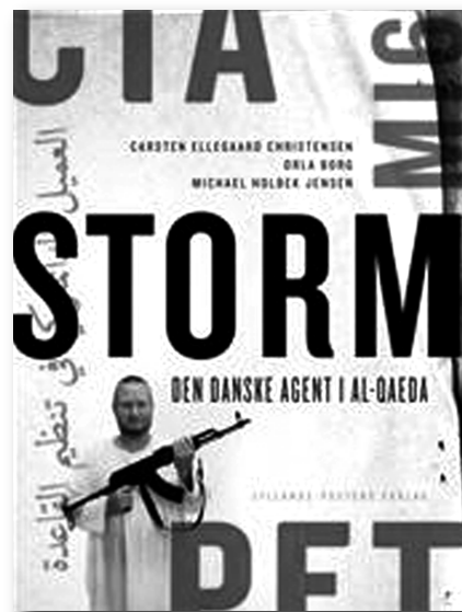
Carsten Ellegaard Christensen, Orla Borg, Michael Holbæk Jensen: STORM. Den danske agent i al-Qaeda. Jyllands-Postens Forlag. 287 sider. 250 kr.

Mørklægningen af statens aktiviteter vedrørende statens sikkerhed og antiterrorisme i Danmark er usædvanlig omfattende i forhold til andre demokratiske stater som f.eks. de øvrige skandinaviske lande samt Tyskland, England og USA. Man må i høj grad undres over, hvorfor den danske central-administration skal være så overdreven hemmelig,