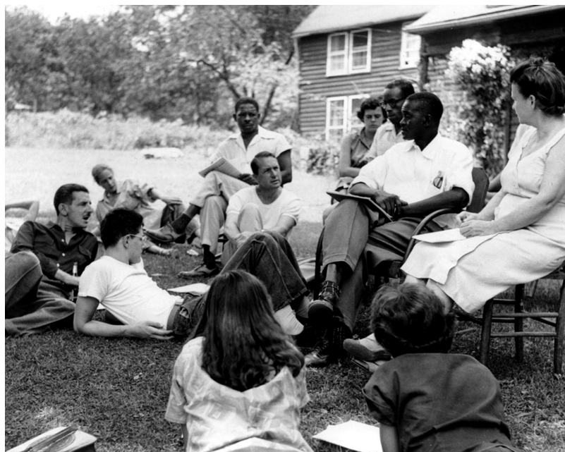
Integreret workshop i The Highlander Folk School. Bemærk billedet er taget i 1950'erne i de amerikanske sydstater, hvor raceadskillelseslove stadig blev håndhævet

fattige amerikanske industriarbejdere og borgerrettighedsforkæmpere efter 2. Verdenskrig i en institution, The Highlander Folk School , 4) som er inspireret af den danske højskole tradition.