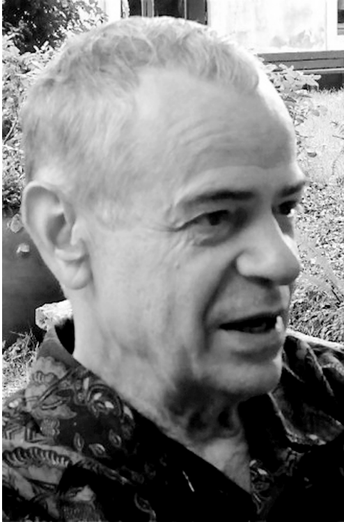
François Flahault, fransk filosof og socialantropolog, elev af Claude Levi-Strauss.

Flahault trækker her på de seneste årtiers landvindinger inden for primatologien der ejendommeligt nok ikke har vakt den store interesse, skønt de radikalt rokker ved forudsætningerne for vor viden om mennesker og samfund: Allerede et par millioner år før mennesket har vore slægtninge blandt primaterne, aberne, levet i samfund, dannet grupper hvor medlemmerne genkender hinanden, har udviklet gensidig afhængighed og hengivenhed inden for et socialt net af meget subtile vekselvirkninger. Dette er fundamentet for udvikling af yderligere relationsskabende adfærd med brug af ”stemme, kropssprog, gestik, mimik og mere eller mindre komplekse koder, afgrænsning af boplads og territorium, teknikker og pynt etc.” (ibid.) i en langsom glidende overgang mellem aber og mennesker: