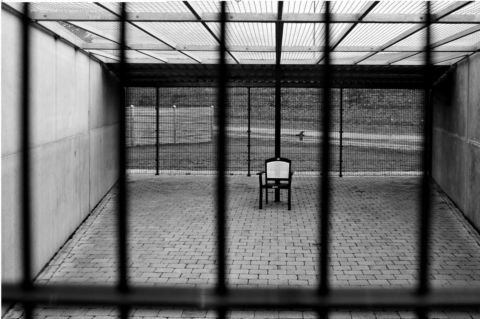
Fængselsgård i Vestre Fængsel.

selvbeskadigelse og endog selvmord i afdelinger, hvor fangerne har været underlagt isolation, sammenlignet med der hvor fangerne har et ordinært fællesskab. 3) Individuelle reaktioner kan variere – nogle kan håndtere isolation bedre end andre. Negative helbredsmæssige virkninger kan opstå allerede efter få dage, og skaderisikoen stiger med hver dag, der går. 4) Et problem er, at ingen kan vide på forhånd, hvordan en person vil reagere på isolation.