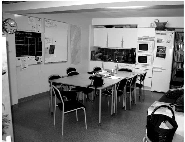
EXITs kombinerede køkken og mødelokale i Fryshuset