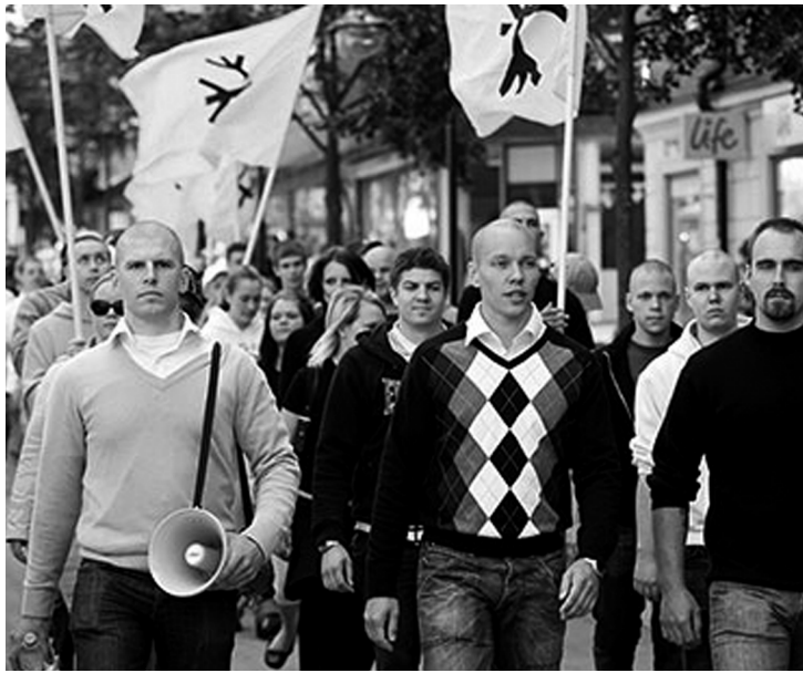
Vit Makt på gaden