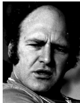
Forfatteren Ken Kesey