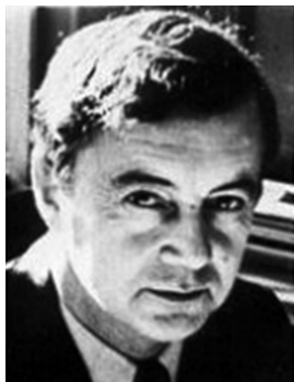
Sociologen Erving Goffman

Psykiatrien har haft svært ved, eller ikke ønsket, at se på sig selv som social organisme, endsigesom magtudøvende instans. Den måde, som psykiatrien ser på, dens tunnelsyn, har gjort den blind for andre væsentlige forhold end de syge og deres symptomer – der er ting, den ikke kan se, på