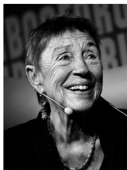
Forfatteren Jytte Borberg