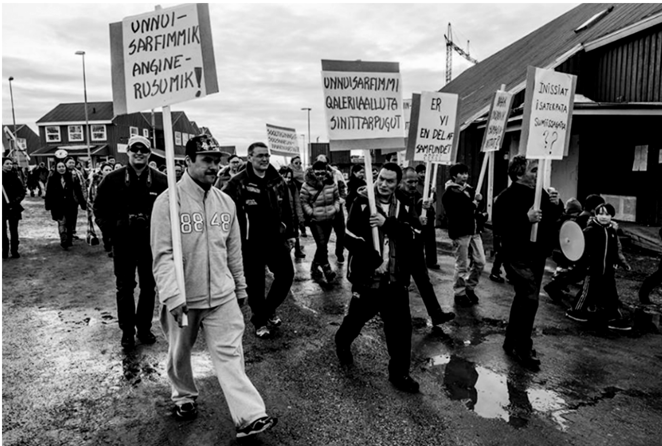
I marts 2013 kunne den grønlandske avis Sermitsiaq AS rapportere fra en hjemløsedemonstration i Nuuk. Hjemløse og deres sympatisører ville skabe opmærksomhed om de hjemløses situation under valgkampen til kommunalvalget.

lisering af det administrative system, uddannelsestilbud, behandlingstilbud og erhvervsmuligheder betyder, at Nuuk er blandt de få byer i Grønland, hvor indbyggertallet er stigende. Næsten hver tredje indbygger bor i dag i hovedstaden. Det er problemstillinger, som vi på Ilisimatusarfik (Grønlands Universitet) bearbejder sammen med Memorial University i Canada. Der ses lignende problematikker inden for hjemløshed på tværs af arktiske områder som Grønland, Nordcanada og staten Alaska i USA 5 ). Den seneste danske hjemløsetælling, der blev foretaget af VIVE (Det Nationale Forsknings- og Analysecenter for Velfærd/Viden til Velfærd), viser, at man således har 440 mennesker i hjemløsetællingen med en grønlandsk baggrund 6 ). Canadisk forskning bekræfter ligeledes, at der i de sydlige storbyer er en overrepræsentation af mennesker med en oprindelig folkebaggrund.