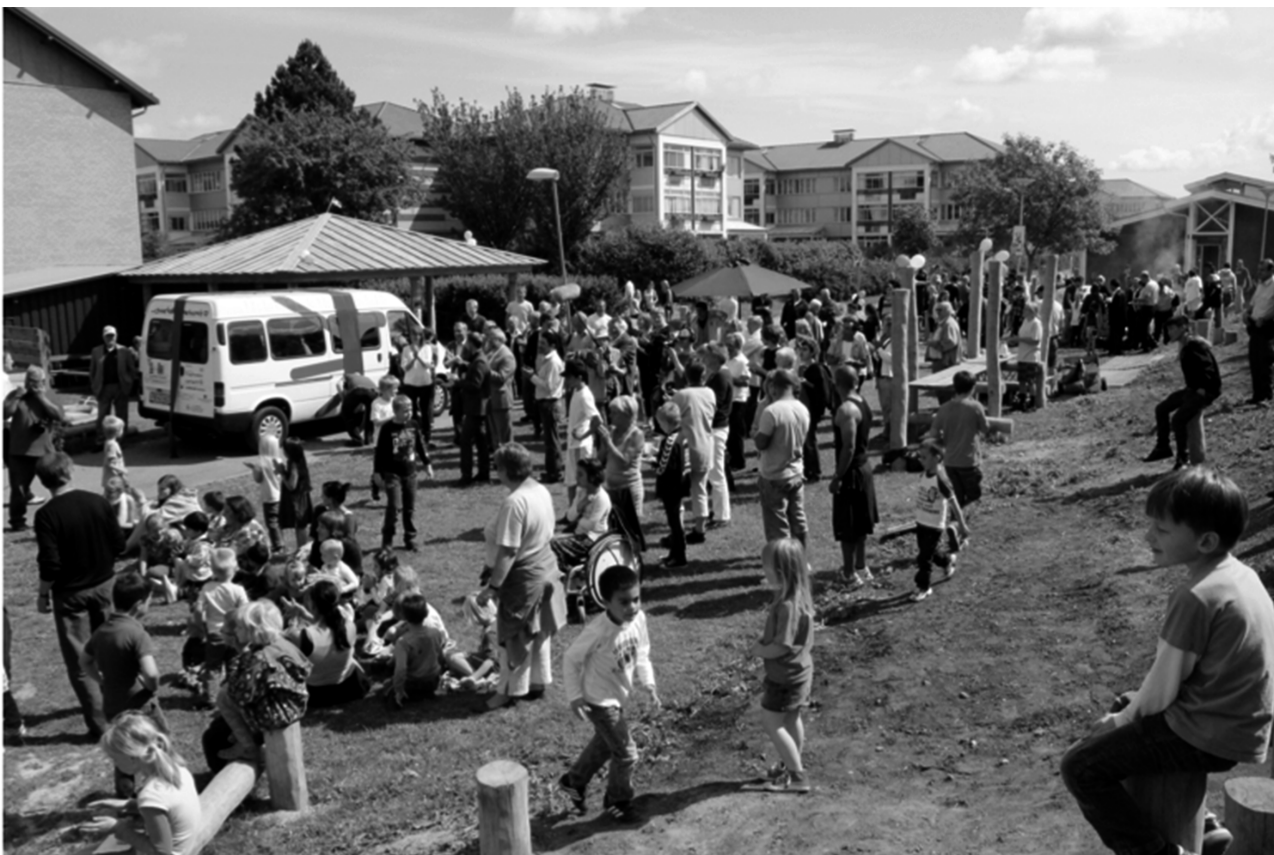
Figur 4: Den store reception.

processen et vigtigt element i at skabe ejerskab til projektet. Udover at designe projektets logo, som kom til at bære navnet "De aktive unge", var det også de unge selv, der valgte det arbejdstøj, de skulle bruge.