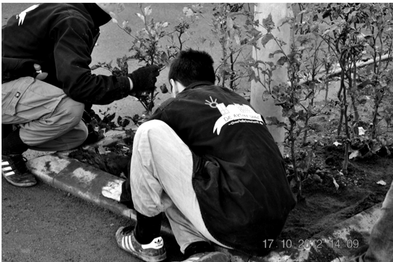
Figur 3: 'De aktive unge'.