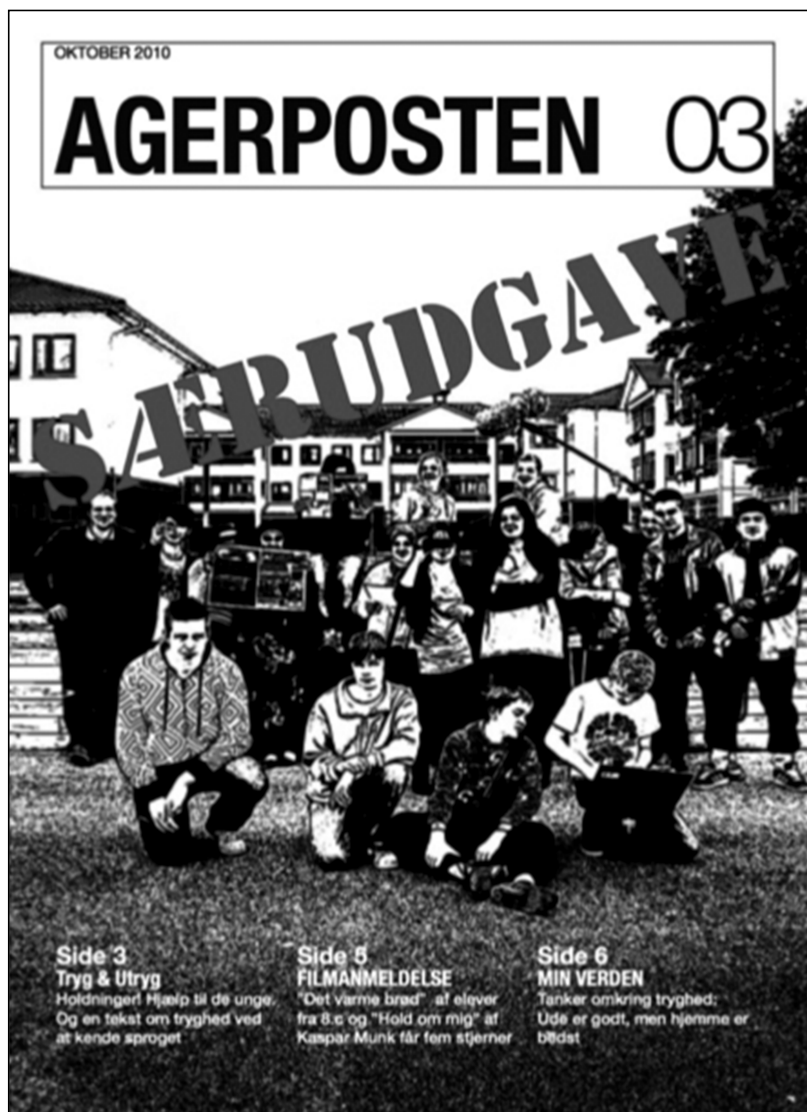
Figur 2: Særudgaven af Agerposten

AH: De [unge] laver nogle brætspil til at gå ud og interviewe de ældre med omkring tryghed og utryghed. Det vil sige, de unge går lige pludseligt ud og interviewer og spørger de ældre, "hvorfør er du utryg?" Allerede der går man jo ind og piller ved sådan en holdningsbearbejdning i den måde, de unge møder det etablerede, der peger fingre af de unge som årsagen til utryghed 3) .