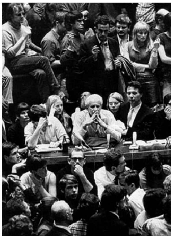
Herbert Marcuse blandt studenter i Berlin 1968