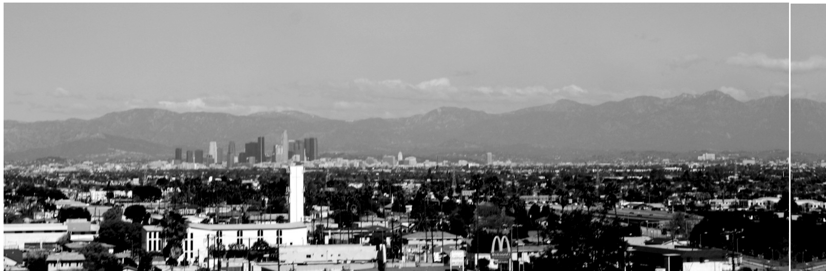
Megabyen Los Angeles – et areal på størrelse med Sjælland og 10.2 mio indbyggere.

Et eksempel på, hvorfor vi har brug for en ny tilgang, finder man i en artikel fra Los Angeles Times (Spano 2007), som fortæller om en gruppe bandemedlemmers pågribelse og arrestation. Disse gruppe-medlemmer intimiderede beboerne i et lokalområde og kontrollerede narkotikahandelen samme sted. Repræsentanter for FBI udtalte, at denne nye gruppe havde opfyldt det tomrum, som en anden gruppe havde efterladt sig, da den blev elimineret seks år tidligere i forbindelse med en indsats mod gadebander. Den måde, dette tidligere forløb udspillede sig på, bekræfter, hvad jeg for mange år siden skrev: "Efter at sherif embedet havde gennemført en udrensning i Barrio Cuca i 1978, hvorunder man anholdt og fængslede et antal meget aktive bandemedlemmer, var der relativt fredeligt i lokalsamfundet et par år. Men eftersom man kun havde sat én gruppe ud af spillet, var det et spørgsmål om tid, før en ny gruppe dukkede op. Og når den gjorde det, ville gadelivet i bar-