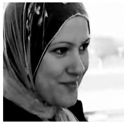
Fotos fra DR's hjemmeside: http://www.dr.dk/Undervisning/jobforalle/forside.htm