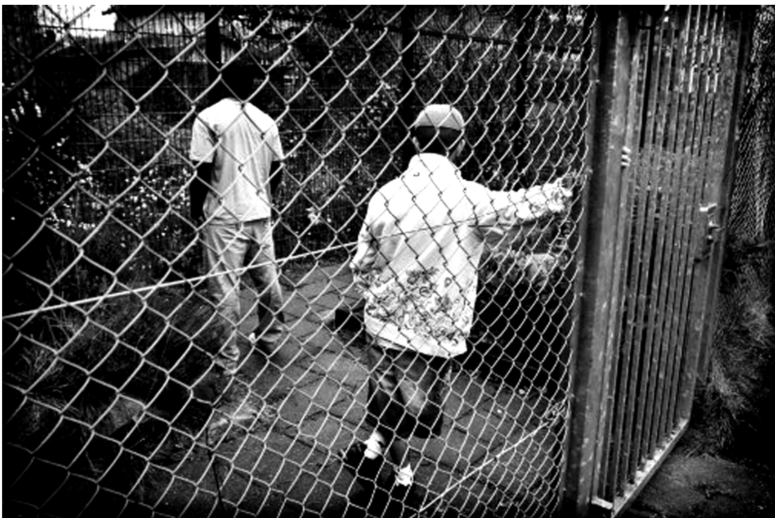
To drenge spærret inde på Sønderbro på Amager.