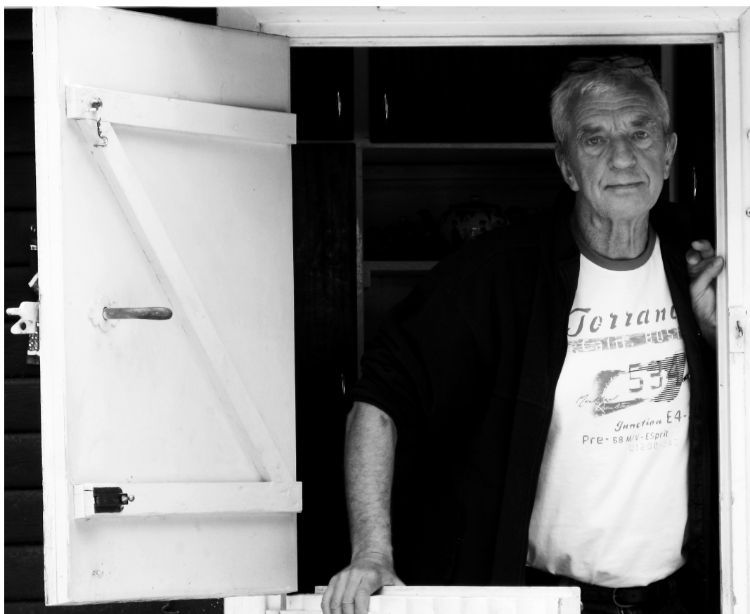
FLEMMING RØGILDS

inensiske studerende at få en universitetsuddannelse, og den granskende mistænksomhed, de er underkastet, og hvor vanskeligt det er for mange af dem blot at komme til forelæsningserne.