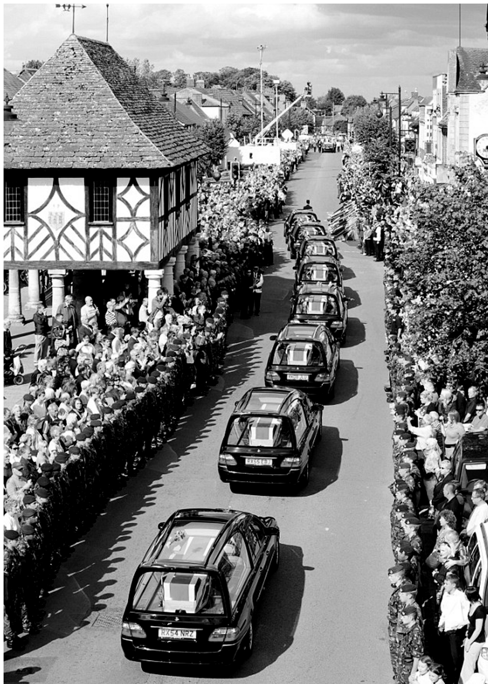
Nationalt sindelag: Hjemkomst parade i Wootton Bassett.