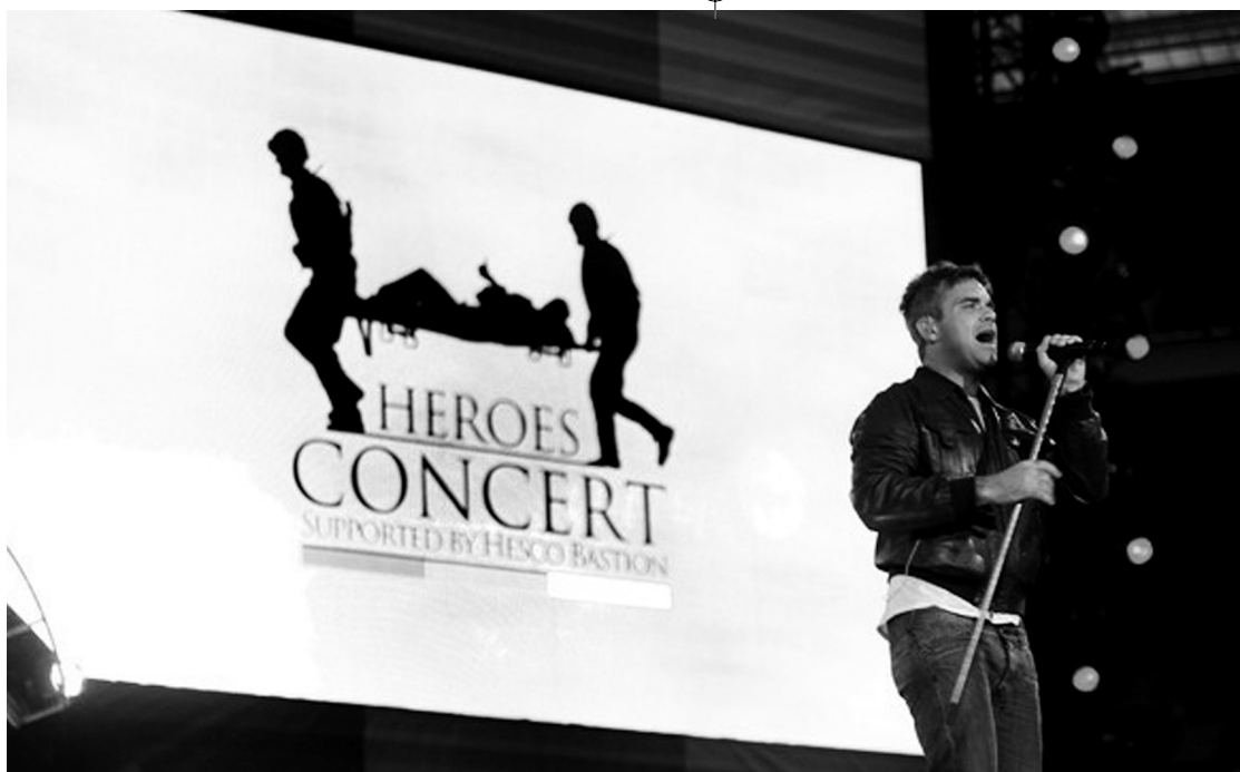
I 2007 blev organisationen Help for Heroes (H4H) stiftet. En velgørenhedsorganisation, der samler penge ind til sårede soldater. På billedet med Robbie Williams' hjælp ved en støttekonzert.

Hvis folk forekommer at være fuldstændig uinteresserede – hvilket de er – er det, fordi de ikke har nogen egentlig forståelse af, hvad de væbnede styrker egentlig udfører. De ser på tv, hvad der sker i Afghanistan og Irak, og fortsætter så deres liv uden tanke for, hvad der sker for vores soldater. De her gutter fortjener vores støtte. 8)