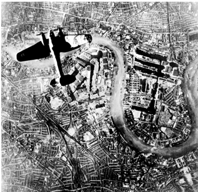
Luftkrig imod byen forblev længe den dominerende bykrigsform, jvfr. bl.a. blitzten over London.

Luftkrig imod byen forblev længe den do-