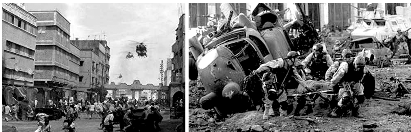
Bykrigsførelse i den tredje verden, Amerikas militariserede politihåndhævelse i "den menneskelige jungle" som for eksempel Mogadishu i 1993, udviklede sig til et dystopisk mareridt for både amerikanere og somaliere (præcist indrammet i Ridley Scotts film Black Hawk Down fra 2001).

derimod Mark Bowdens bog fra 1999 (og Ridley Scotts film fra 2001) om slaget i Mogadishu i 1993, Black Hawk Down , der reducerer den somaliske befolkning til en ansigtsløs og aggressiv pøbel, en animalistisk mørk kraft der truer og dræber amerikanerne. Bagholdsangrebet i Somalia er en vigtig reference i næsten al litteraturen som sandhedsvidnet på den nye form for tredje verdens bykrig. 25) Der er en klar dystopisk klang i meget af litteraturen, der forestiller sig en kommende opdeling i verden i velfungerende men pressede (vestlige) stater og så ødelagte, nedbrudte slumstater, hvor kun elendighed og kriminalitet hersker, og hvorfra man kun kan forvente terrorisme og sygdomme.