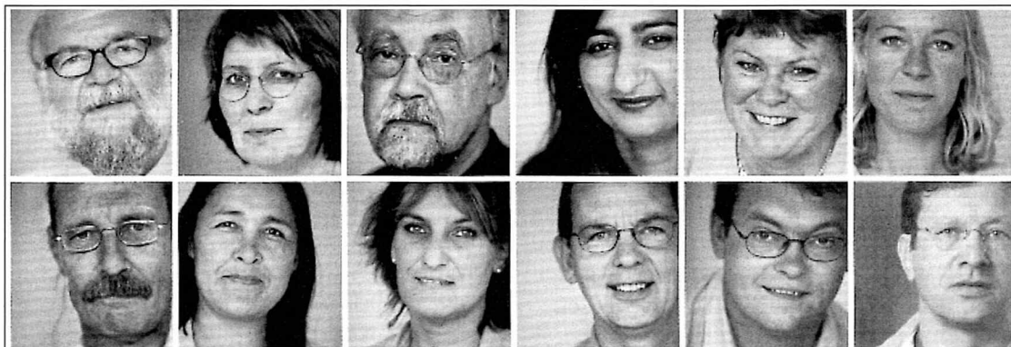
De Udsattes Råd, foto fra Årsrapport 2004.

Magtdiskussionen refererer her til mulighederne for at påvirke eget liv og de ydre betingelser, der rammesætter det: F.eks. sociale rettigheder, reelle mulighe-