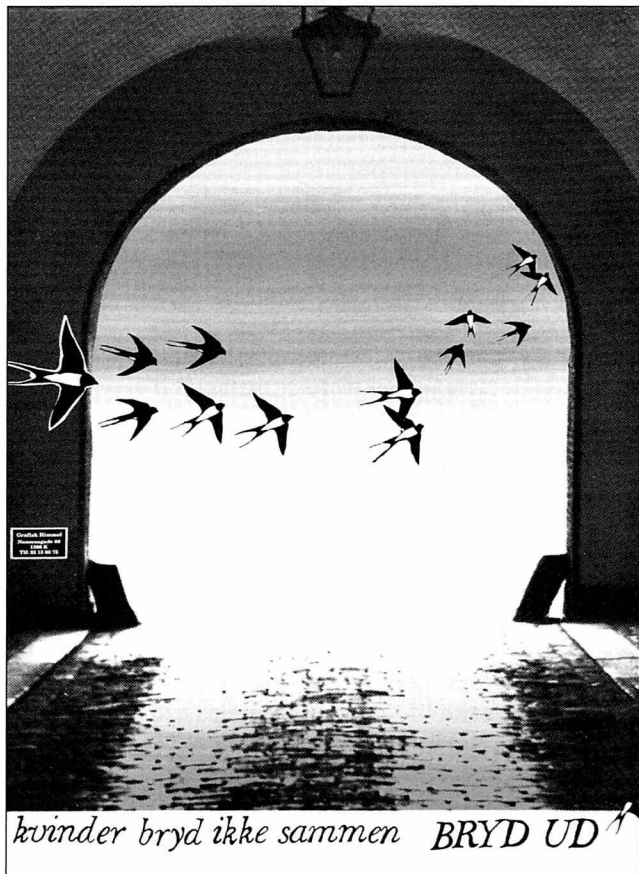
Kvindekampsplakat. Serigrافي af Susanne Whitta-Jørgensen

årsagerne til afmagt. Formuleret slagordsagtigt: Opbygning af kollektiv udadvendt vrede frem for individuelt indadvendt selvhad. Et eksempel er den nye kvindebevægelse som med parolen "Gør det private politisk" i 1960'erne var et klart eksempel på identitetsempowerment.