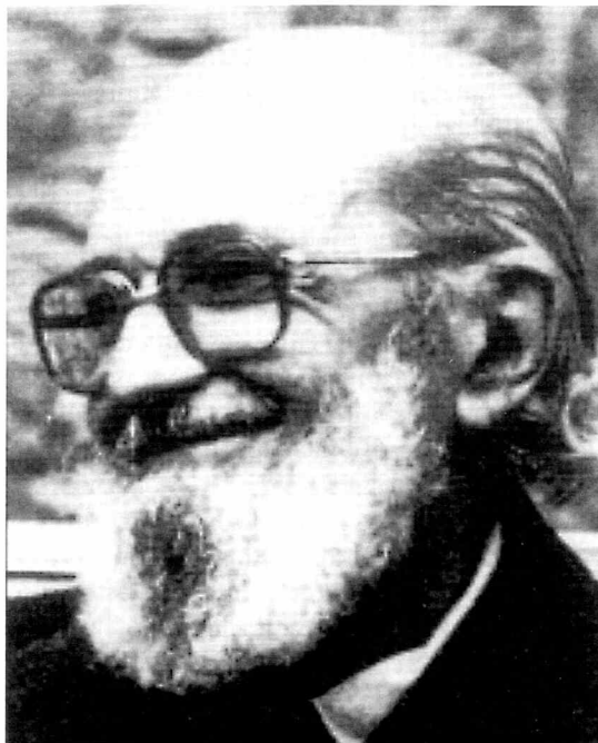
Paulo Freire (1921-97).

"Med empowerment mener jeg kapacitet, ressourcer, information og viden,