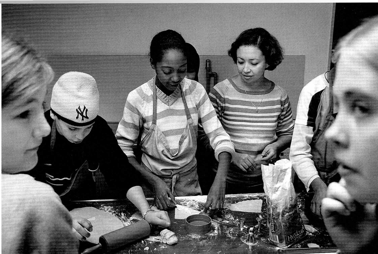
Hjemmekundskab i 7. z på Hellig Kors Skole. De fleste elever i klassen har arabisk baggrund og er muslimer. Der er to etnisk danske elever i klassen

Undersøgelsen fra Arbejderbevægelsens Erhvervsråd viser også, at på "svage skoler" er karaktergennemsnittet i matematik klart lavere end på de "stærke" skoler. På de "stærke" skoler i København var karakteren i matematik efter 9. klasse 8,43, mens gennemsnittet på den mest belastede fjerdedel af skolerne var 7,28.