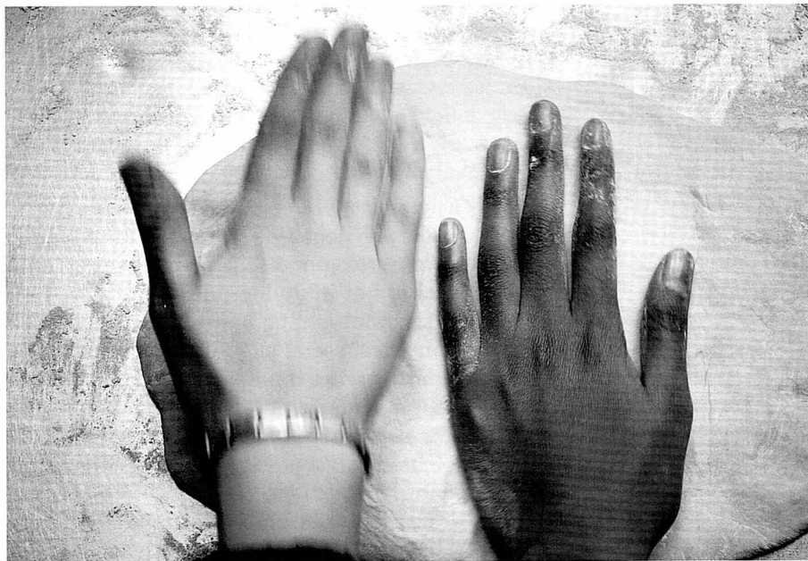
Samarbejde omkring baging i hjemkundskab