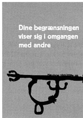
Plakater fra ombygningsprocessen udarbejdet af kunstnerne Kenneth Balfelt og FOS.