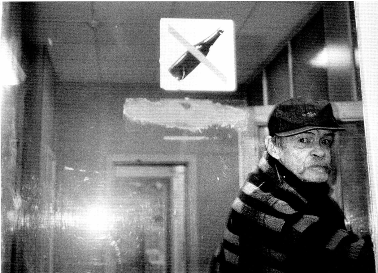
Mændenes Hjem ved natteid.

Mange steder er delt op efter forskellige paragraffer, så tilbud efter Service-lovens § 94, § 91 og § 88 i dag udgør en bredere vifte end tidligere. Det er selvfølgelig en udløber af ændret lovgivning og nye centrale initiativer som for eksempel "skæve boliger" til mennesker, der har svært ved at finde sig til rette i de "almindelige" boligområder, og alternative plejehjem til ældre misbrugende hjemløse. Det mest iøjenfaldende eksempel på omstrukturering er de ændringer, som er sket i København, hvor Sundholm er nedlagt som centralt forsorgshjem, og der er etableret flere decentrale boformer.