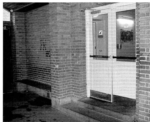
Øverst det gamle indgangsparti.

Vi ønsker at skabe en tryk platform for den udstødtes ellers meget ustabile og kaotiske liv. Den skabes ikke blot via tillid og hjælp fra personalet, men også i det