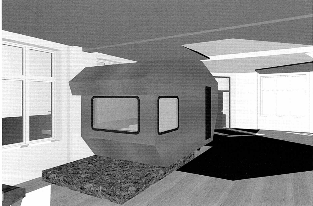
Model af campingvogn i stuerne

fysiske miljø, brugere og medarbejdere færdes i. Derfor bruger vi stabile materialer som massivt træ, solide møbler, terrazzo og kobber.