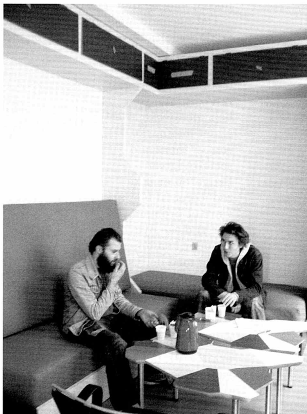
Den gamle reception, nu ombygget til observations/sove- og samtalerum.

Vi har for eksempel holdt workshops, som ikke kun har benyttet sig af den verbale