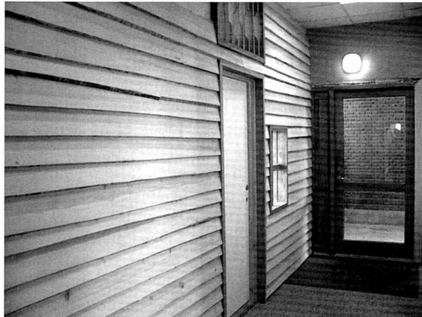
Nederst ses facaden til det nye rum opbygget som en bjælkehytte.