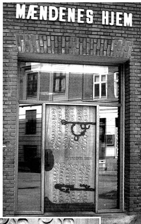
Nedest den nye egetræsdoor med udskæringer.