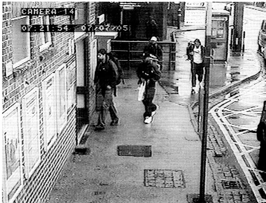
"Multikulturalismen" overvåget af kameraer ved Luton undergrundsstation – bag en facade af almindelighed de sidenhen så dæmoniserede skikkelser "hjemmeavlede terrorister".

immigration, men også i forbindelse med den generelle dannelses faldende standarder, der er udtryk for et generelt sænket oplysningsniveau i medierne, uddannelsessystemet og det offentlige liv. Som resultat heraf ender vi med at behandle asylansøgere og flygtninge med brutalitet. Ikke så meget for at forcere deres assimilation, men for at vi kan forsikre os selv om, at vi stadig er de mennesker, vi formodes at være.