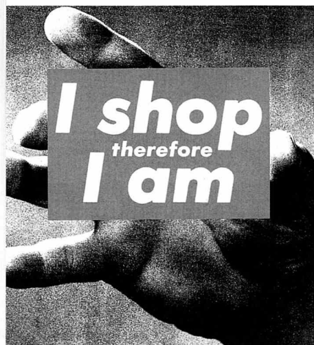
Barbara Kruger: "I shop therefore I am".