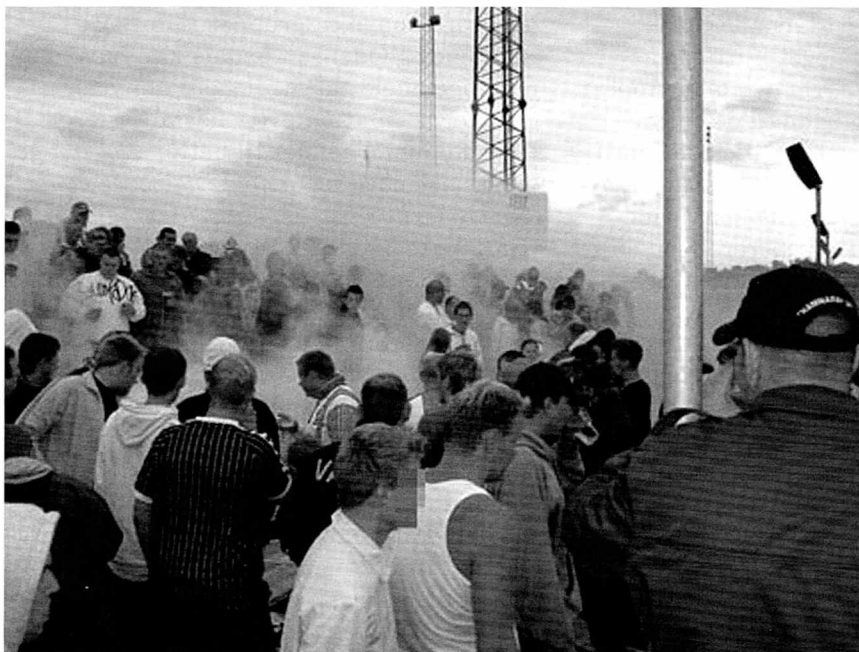
Røg på Horsens stadion

tilsvining af spillere og dommere til psykopatens vold mod tilfældige mennesker. Definitionen af hooliganisme er gradvist blevet udvidet (specielt i medierne), men man skal passe på med at sætte f.eks. fuldskab eller røg fra romerlys lig med hooliganisme.