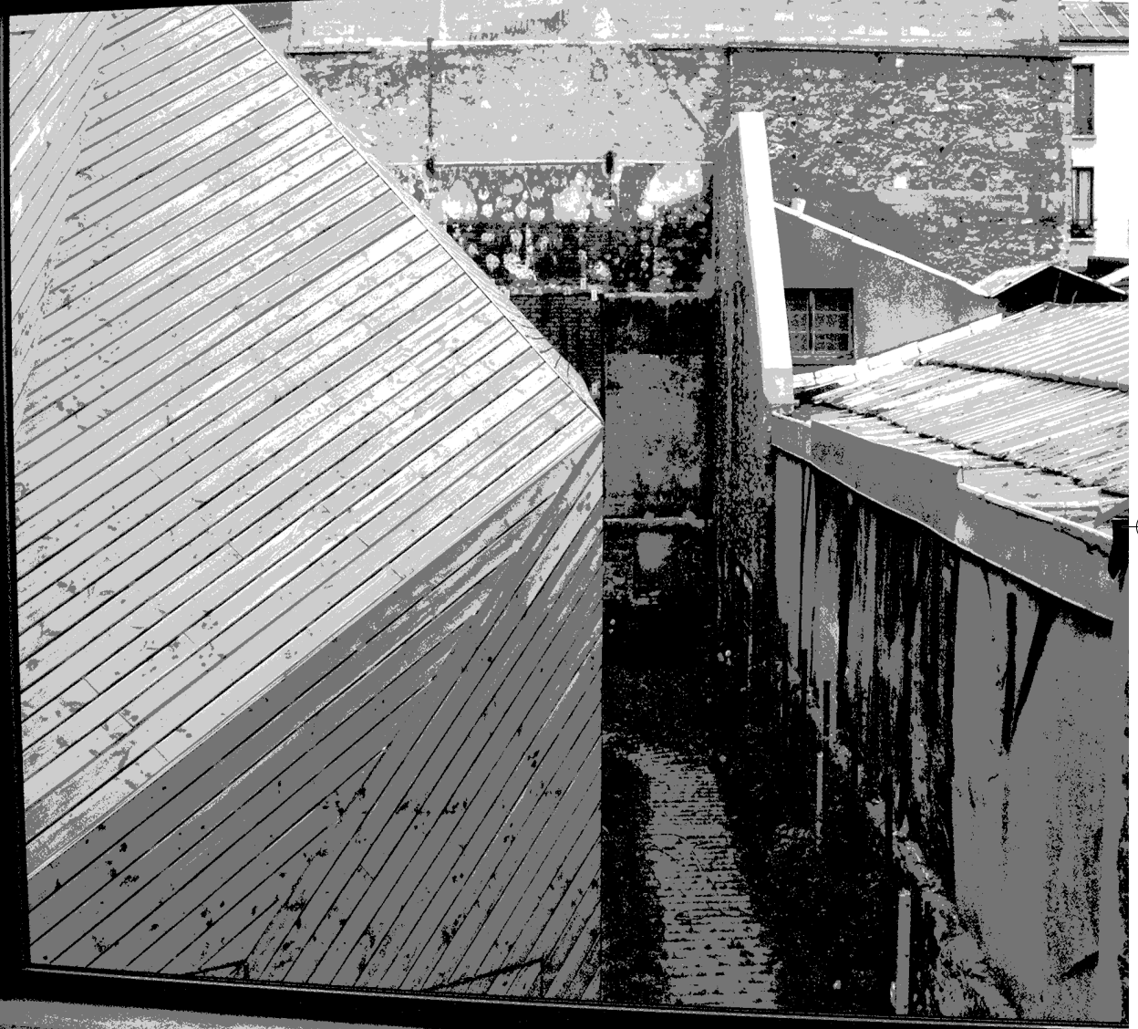
93000 PARIS.