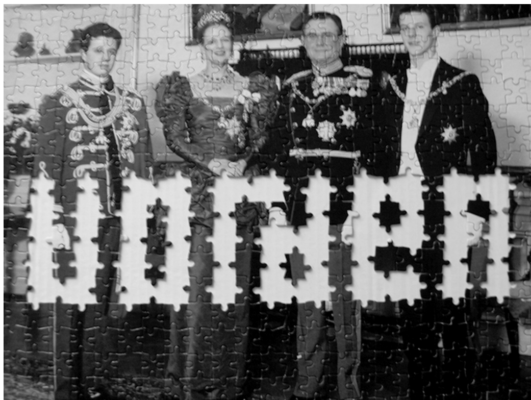
"UORDEN" – et puslespils manglende brikker.

Det spørgsmål kan jeg ikke besvare i denne artikel. Begrebet sammenhængs-