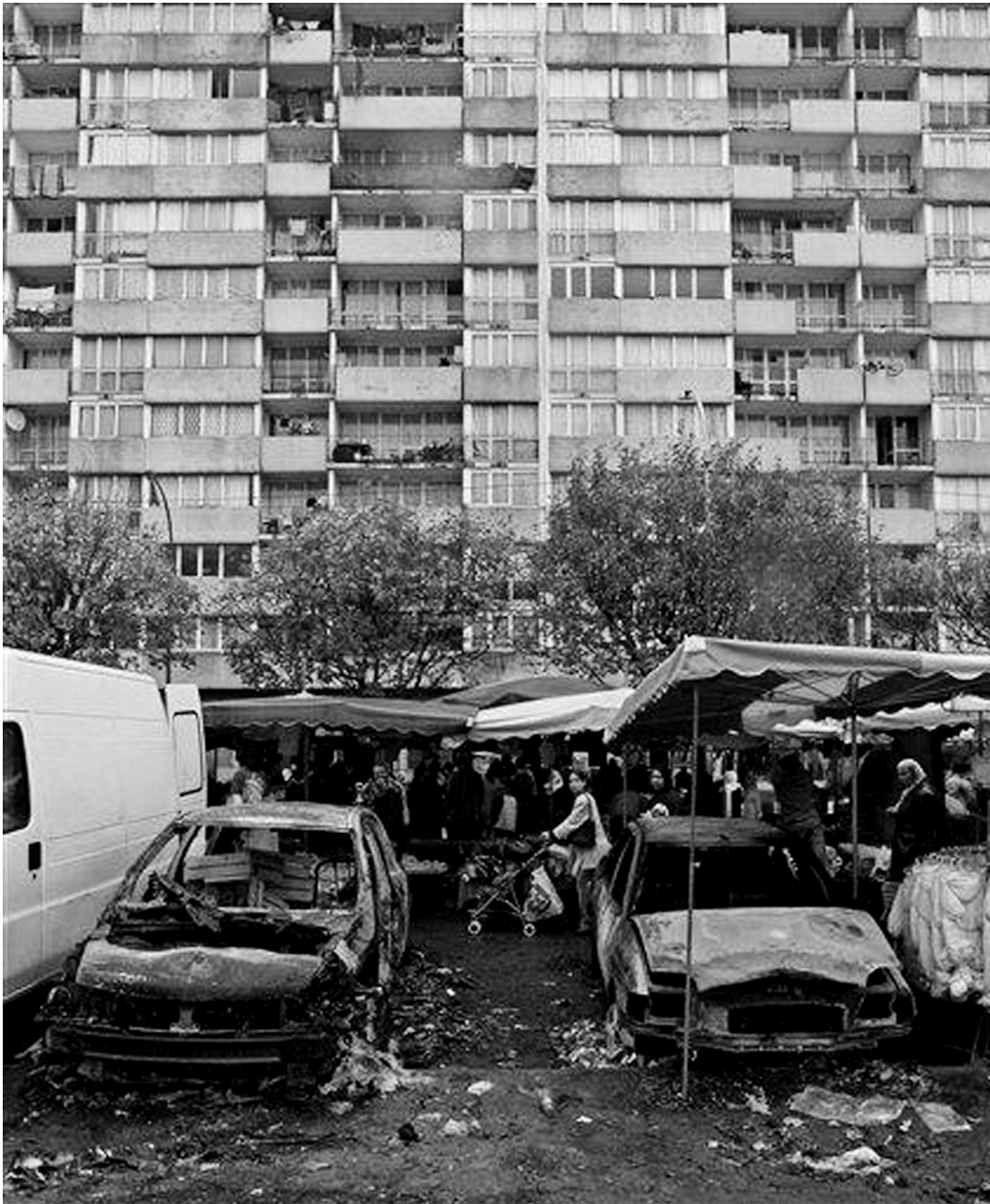
Marked i Clichy-sous-Bois øst for Paris d. 2.11.2005 efter seks døgns riot.