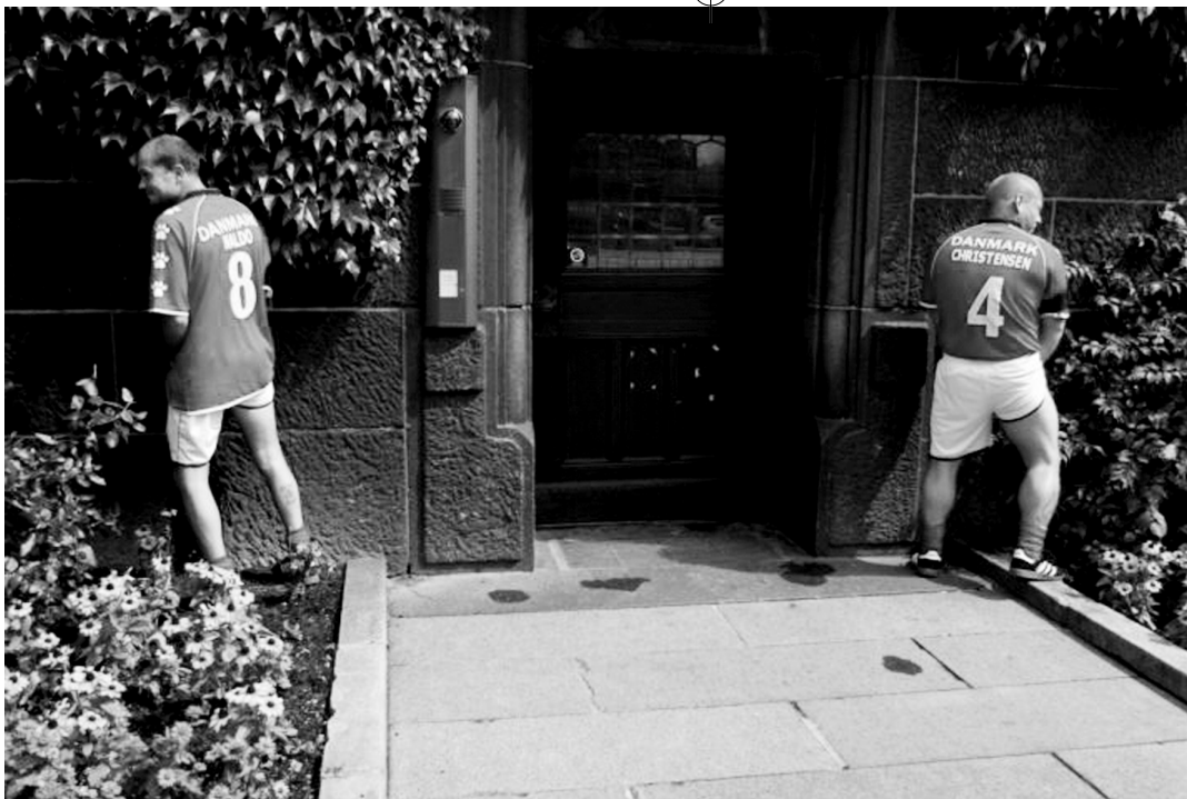
Ombold - "gadebold for hjemløse og udsatte" – er et nyt og markant offentligt finansieret initiativ, som skal øge sundhed, udvikle sociale kompetencer og reducere misbrug. Besøg ombold.dk og se de livsbekræftende billedgallerier med bl.a. billeder fra DM og WM i gadebold.