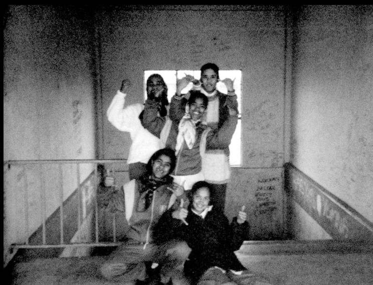
Fotos fra Gangs, Politics & Dignity in Cape Town , taget af en gruppe elever fra en skole i Heideveld med kameraer udleveret til dem af forfatteren.