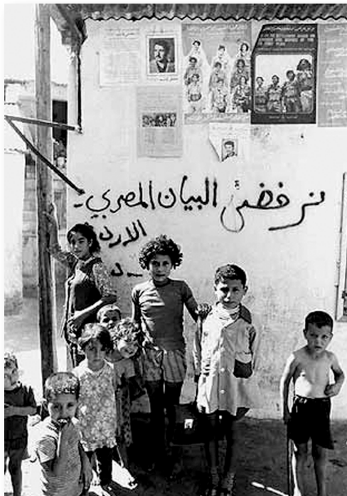
Foto fra Nils Vests film "Et undertrykt folk har altid ret" (1976).

Palæstina-aktivismens pædagogiske punchlines drejer sig i dag ikke om kampen mod den internationale imperialisme og kapitalisme samt retten til folkelig selvbestemmelse, som den gjorde, da Nils Vest lavede sin film Et undertrykt folk har altid ret (1976). I dag er det primært holocaust-, nazi- og apartheid-metaforer, som skal skabe de analogier, der får folk til at få øjnene op for, hvad der foregår mod palæstinerne. Sammenligningerne er med til at gøre palæstinerne til ikoniske ofre, som samtidigt er oversete og ubemærkede trods det store fokus på konflikten, fordi verden jo anerkender holocaust, apartheid og nazismen som forbrydelser mod menneskeheden. Hvorfor vil Vesten så ikke anerkende de palæstinensiske ofre på samme måde? I arabiske, muslimske og palæstina-aktivistiske sammenhænge er forklaringerne ofte, at Vesten entydigt holder med Israel, jøderne styrer verden eller lignende konspirations-teoretiske betragtninger. At sam-