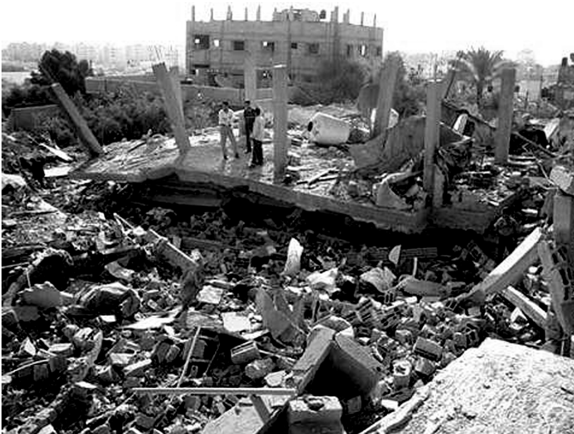
... fortsættelse af en krig.

Ser vi tilbage på det foregående halvår og forløbet af den våbenhvile, som udløb d. 19. december 2008, så har Hamas faktisk gjort meget for at stoppe missilangreb ind i Israel, og de få, som fandt sted i perioden, blev sandsynligvis udført af mindre