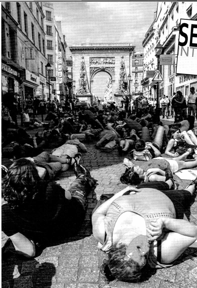
Sexarbejdere i Paris, der demonstrerer for flere rettigheder.