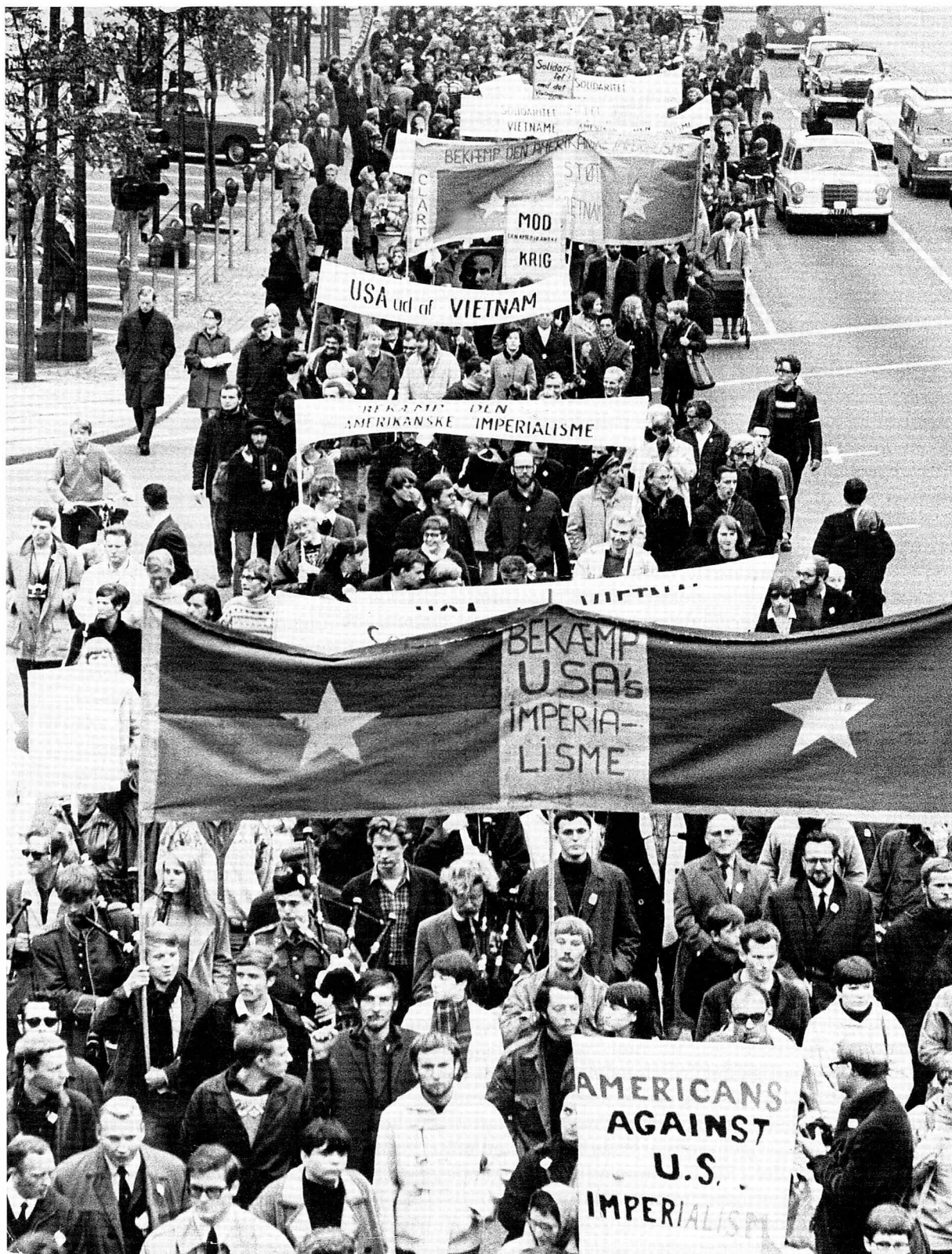
Vietnamdemonstration på Rådhuspladsen.