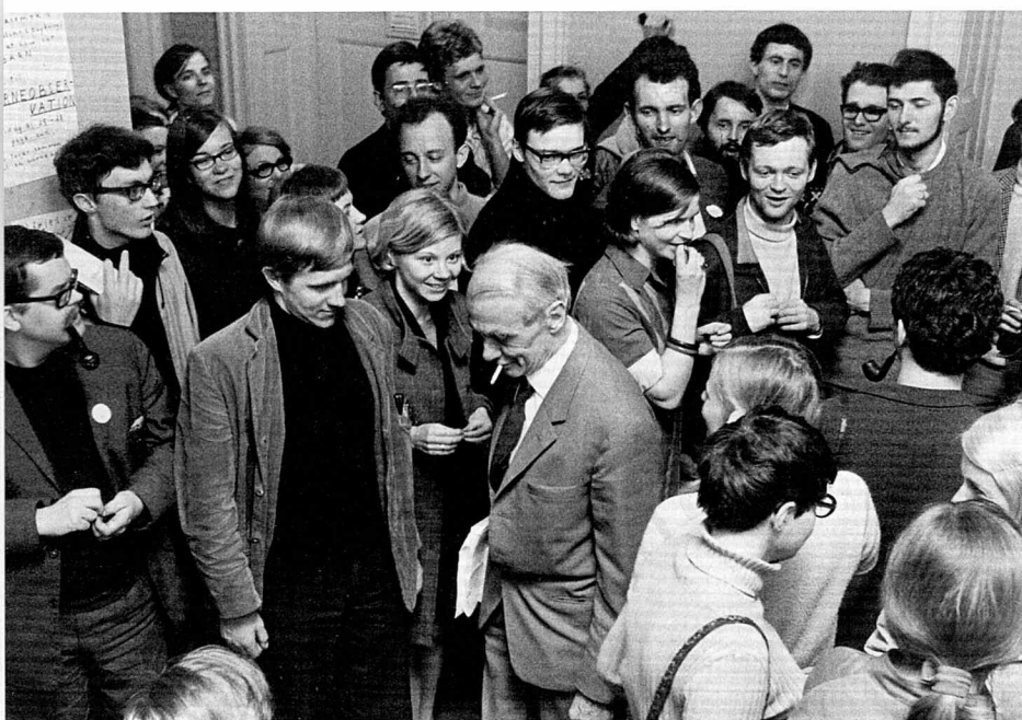
Studenteroprøret på Københavns Universitet i 1968.