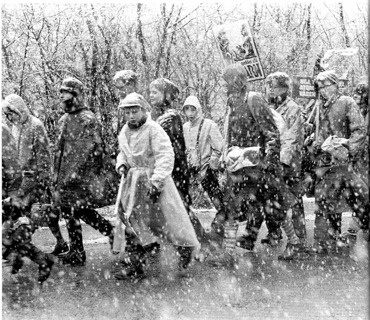
Påskemarch 1961 fra Holbæk til København mod atomoprustning.

Af Morten Bendix Andersen og Niklas Olsen