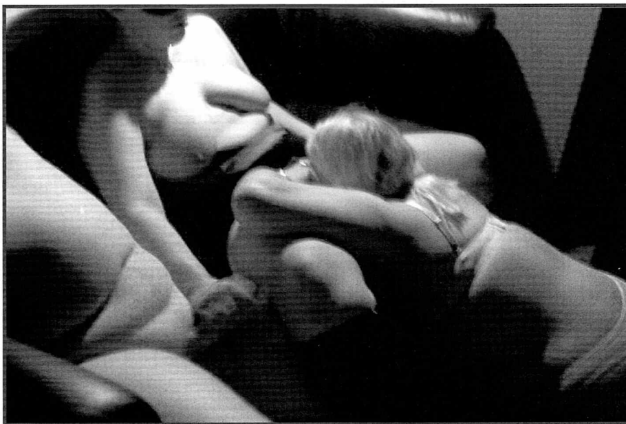
I swingerklubben Adam og Eva i Vanløse forlyster folk fra 18 til 60 år sig med pornofilm, intimbarbering og gruppesex.

krutter ser på overheads af forskellige typer pansrede køretøjer iblandet pornografiske billeder. Berlingske Tidende beretter desuden, at den konservative organisation har svært ved at holde på kvinderne: de flygter fra forsvaret pga dårligt kammeratskab eller "kønskrænkende adfærd" (som sexchikane hedder i forsvaret).