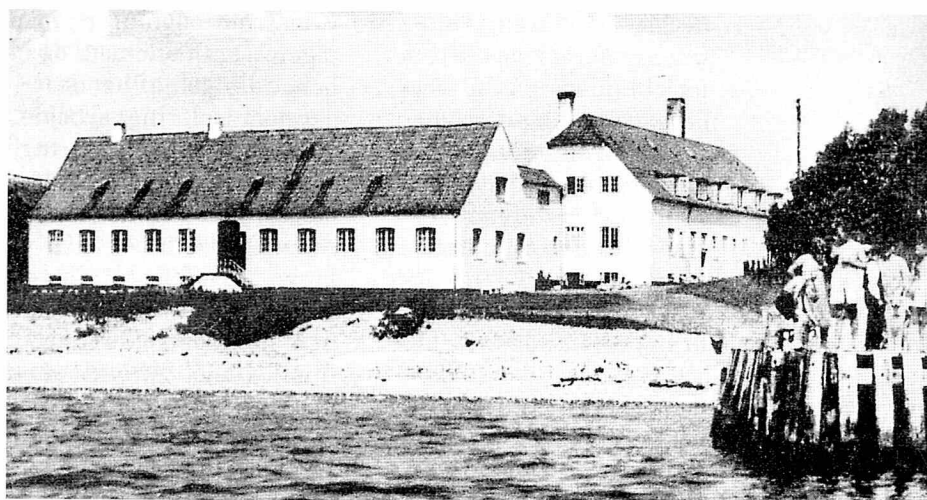
Kvindehjemmet ca. 1935.

De 18 journaler repræsenterer forskellige aspekter af indsættelsespraksis,