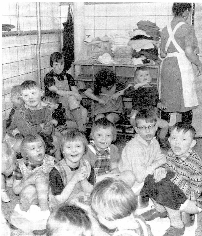
Pottesituation på Andersvænge.