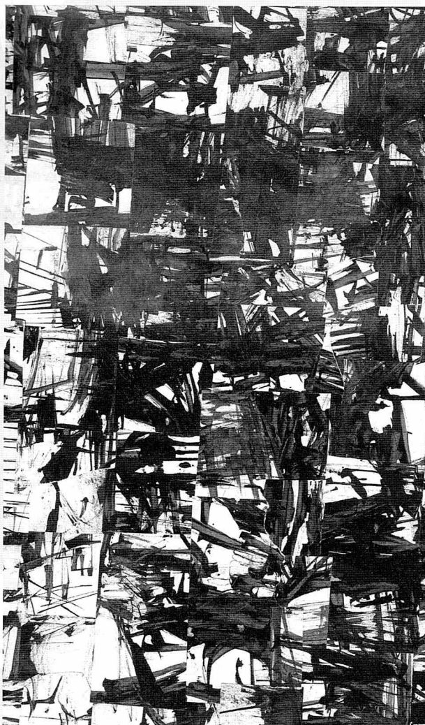
Tegning Gert Hansen