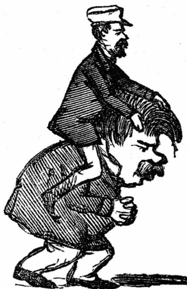
To portrætter af Frederik Dreier fra det satiriske blad Corsaren. Begge fra 1852