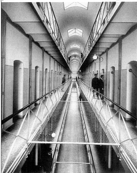
Det moderne fængselsvæsens gennembrud 1770-1870