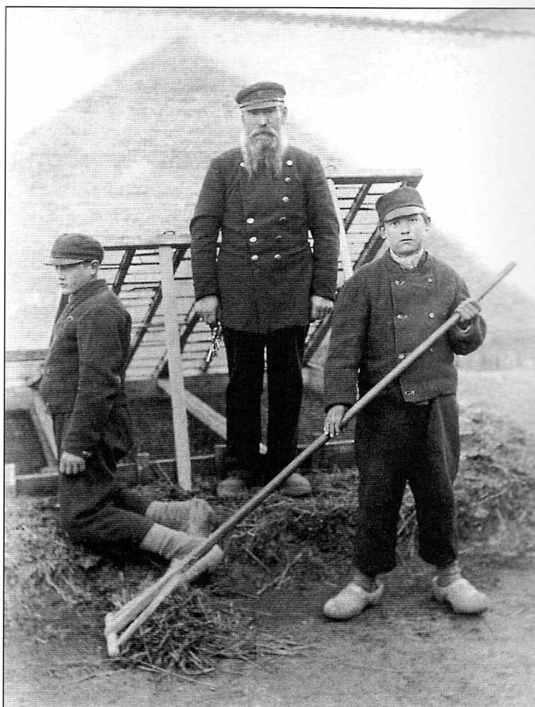
To børnefanger afbildet 1890 i Vridsløselille sammen med den fængselsbetjent, der stod for havearbejdet. Straffeloven af 1866 havde sat den kriminelle lavalder til ti år, og der sad således en række børn i Vridsløselille. Den kriminelle lavalder blev i øvrigt først hævet fra 10 til 14 år i 1905. Dagens børne-kriminalpolitiske høje i det danske folketing synes mest inspirerede af Straffeloven af 1866..