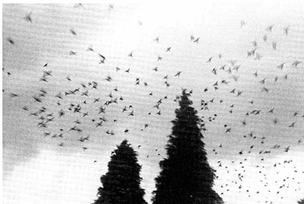
Birds fly around