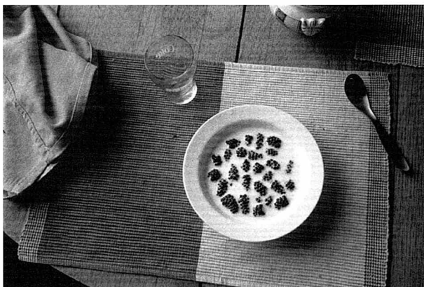
Berries in milk

Oversat af Niels Højensgård, lettere bearbejdet af Benedicta Pécseli.