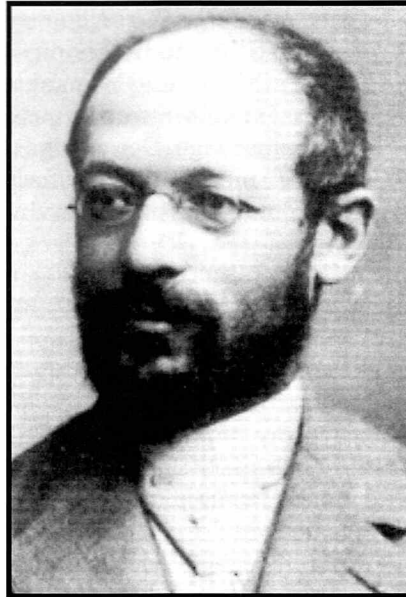
Filosof og sociolog Georg Simmel (1858-1918)