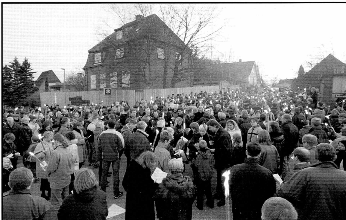
Demonstration i form af sangkor ved Naziborgen i Niels Lykkes Gade 38 i Aalborg.