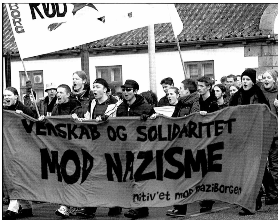
Demonstration mod nazisme i Aalborg februar 1999.

Indenfor rammerne af den store konflikt mellem nazister og naboer udvikledes, som