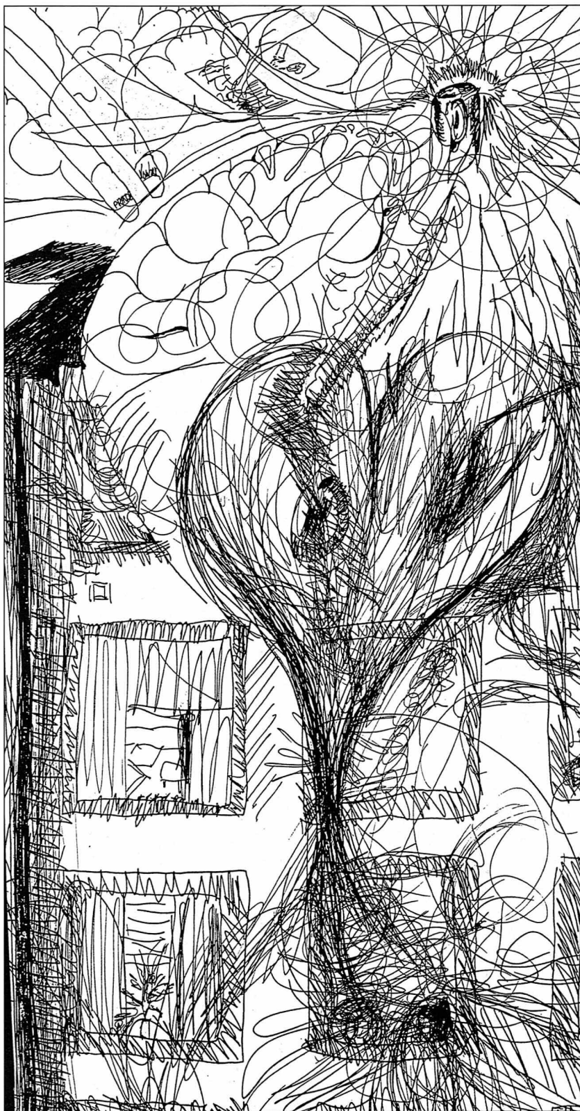
OPGANGSFÆLLESSKABET SUENSONSGADE SET GENNEM EN BEBOERS ØJNE

Hverdagslivet rummer mange forskelligartede aktiviteter. Her vil jeg udelukkende tage afsæt i et beboermøde afholdt i maj 2000. Mødet illustrerer nogle af de mellem menneskelige betingelser beboerne lever med og hvordan de vælger at håndtere disse betingelser. Gennem en beskrivelse af mødet og dets forløb ønsker jeg at tegne et billede af, hvordan jeg oplevede beboernes hverdagsliv indenfor rammerne af det alternative botilbud. Det er i den forbindelse vigtigt at huske på, at hverdagslivet er præget af såvel gentagelser som variationer. Det gælder også blandt de hjemløse beboere i opgangsfællesskabet.