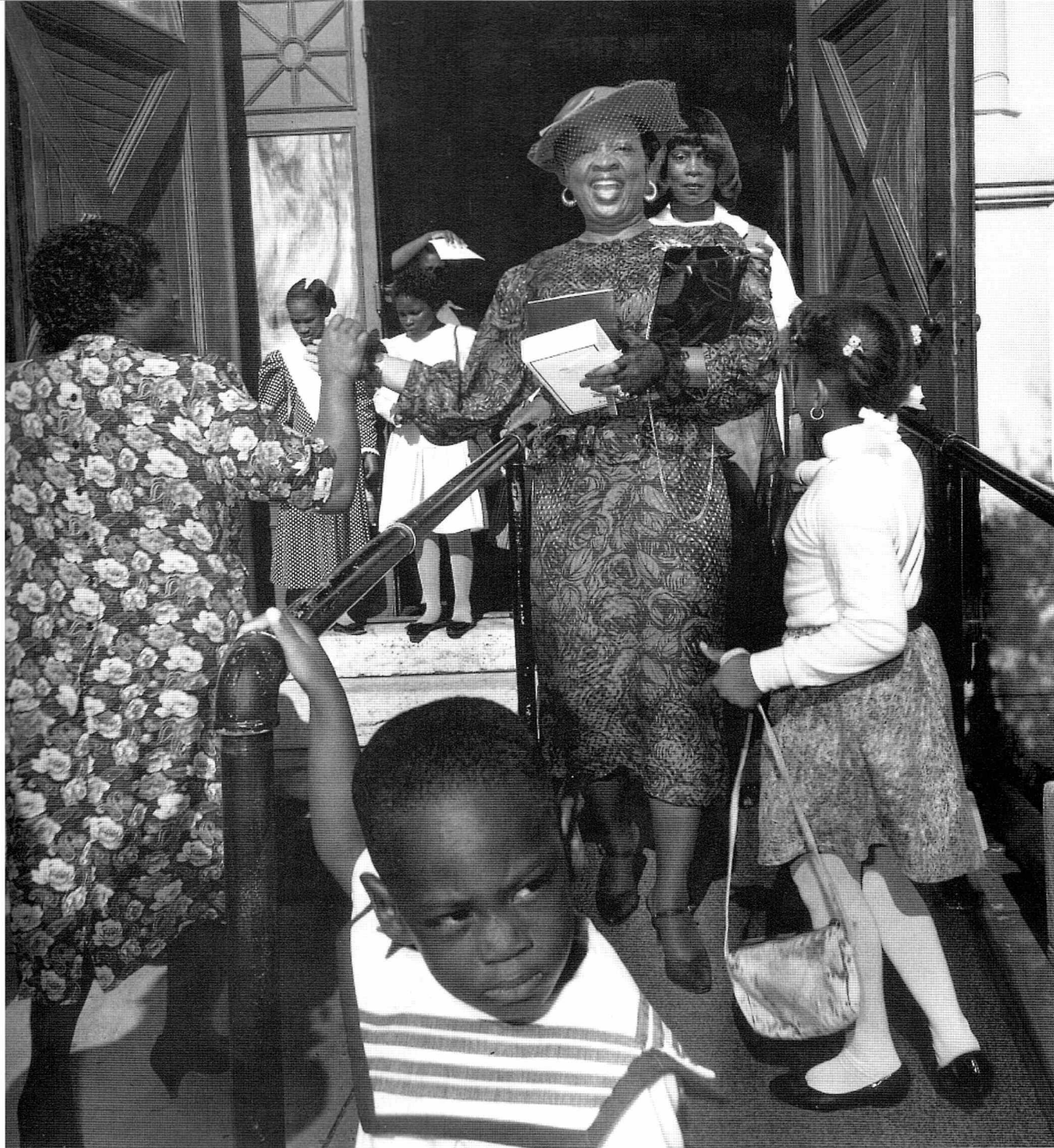
The Galvin Baptist Temple. Carl De Keyzer: God Inc. 1992

Når jeg bringer et længere uddrag fra det pågældende interview, er det fordi Putnam gentagne gange er blevet citeret for at fejlfortolke forholdet mellem velfærdsstat og den sociale kapital som produceres i frivillige og andre af det civile samfunds foreninger. Kritikken