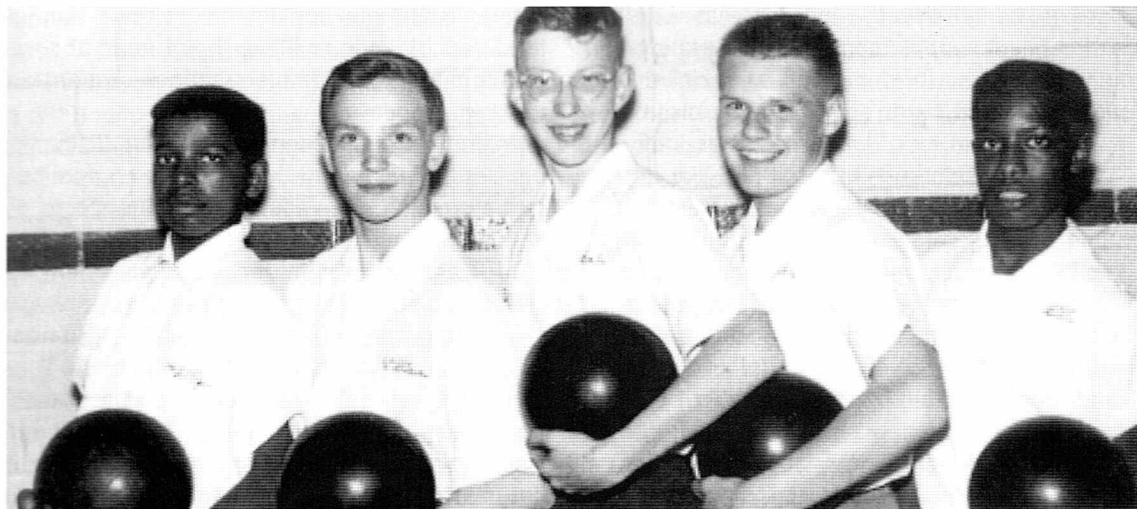
Foto fra bogen "Bowling Alone" til illustration af fænomenet "social kapital".

omkring et utal af sociale og politiske aktiviteter. Det forhindrer os i at deltage aktivt i produktionen af social kapital.