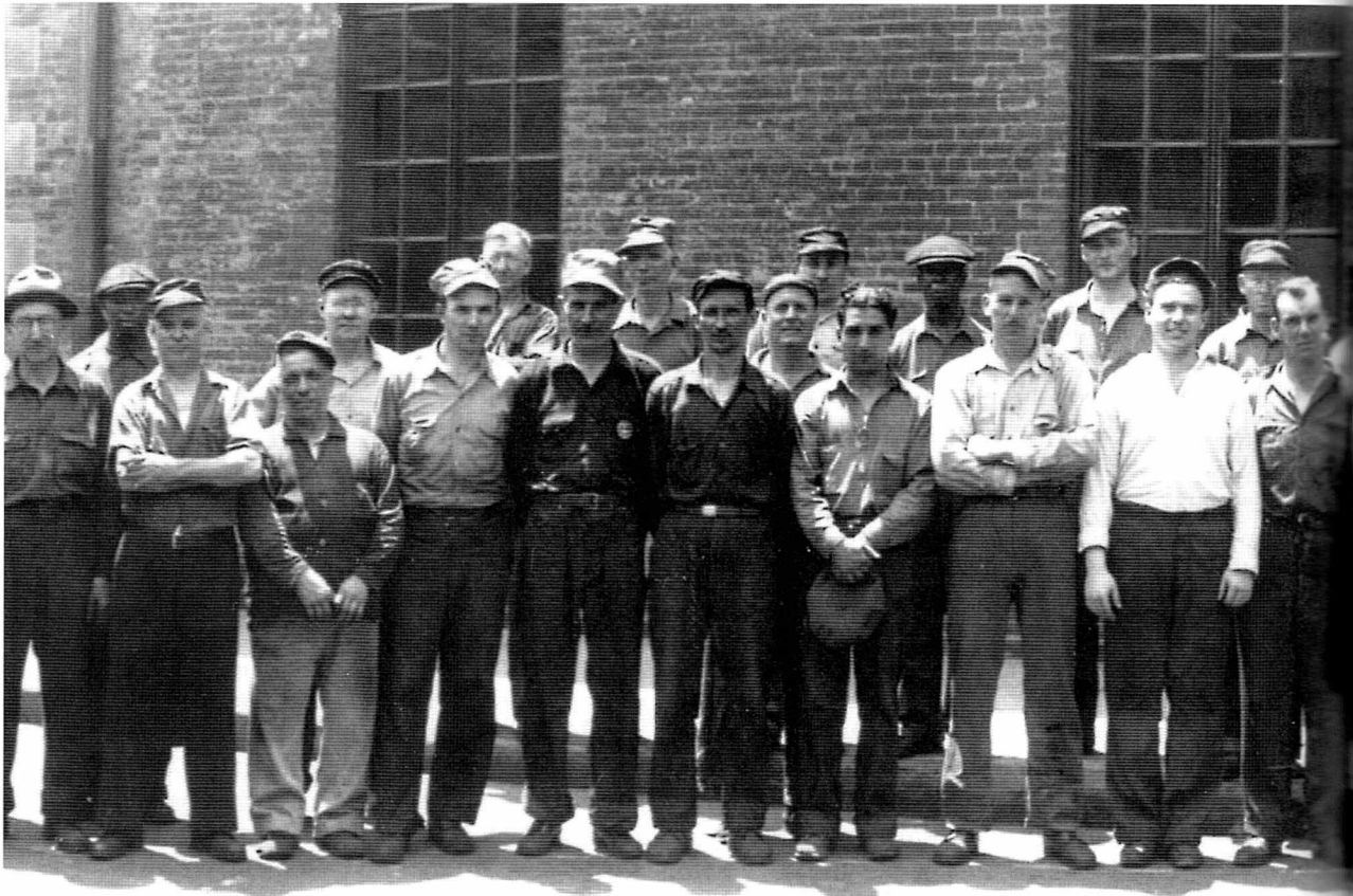
Arbejdere fra Brooklyn skibsværft, 1939. "Det amerikanske Socialistparti blev et stærkt svækket parti, og selv om det overlevede 20 år eller mere efter dannelsen af kommunistpartiet i 1919, så blev det aldrig igen nogen kraft i arbejderklassen. Et særligt forhold var også sproget! I 1919 var 70-80% af partiets afdelinger fremmedsprogede federations. Og de største var de østeuro-

bevægelses historie. Men desværre påvirkede det ikke studenterbevægelsen.