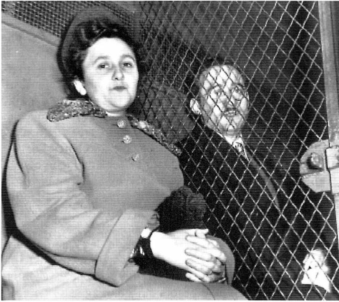
Ethel og Julius Rosenberg bliver transporteret i fængsel efter at være blevet fundet skyldige i spionage i marts 1951