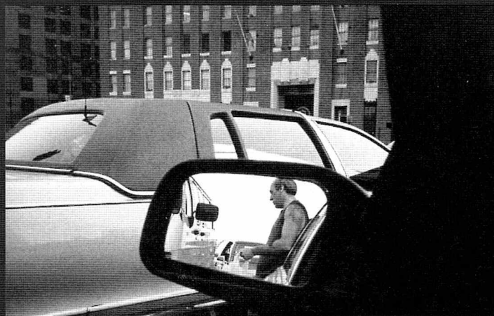
David Bradford. Drive-By Shootings Photographs by a New York Taxi Driver